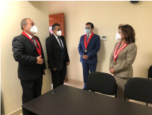
Inauguración de Cámara Gesell en la Corte Superior de Justicia de Arequipa, 2021