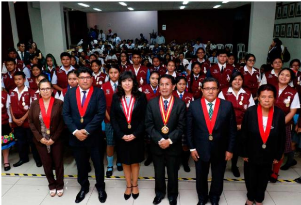
Juramentación de Juezas y Jueces de Paz Escolar en la Corte Superior de Justicia del Santa, 2019