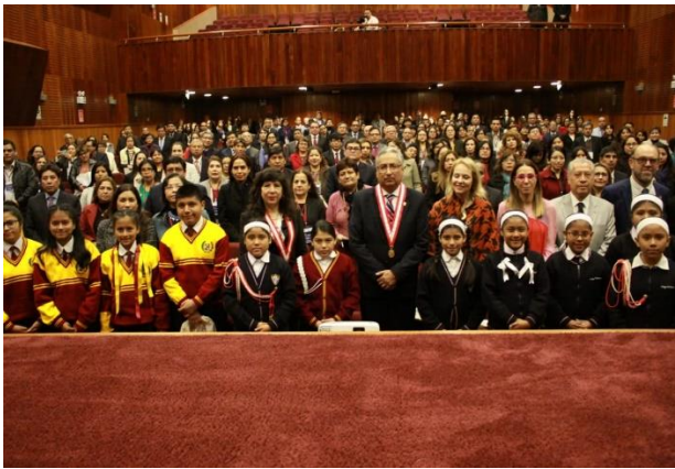
Tercer Congreso Nacional e Internacional de Acceso a la Justicia para Niñas, Niños y Adolescentes Corte Suprema de Justicia, 2019